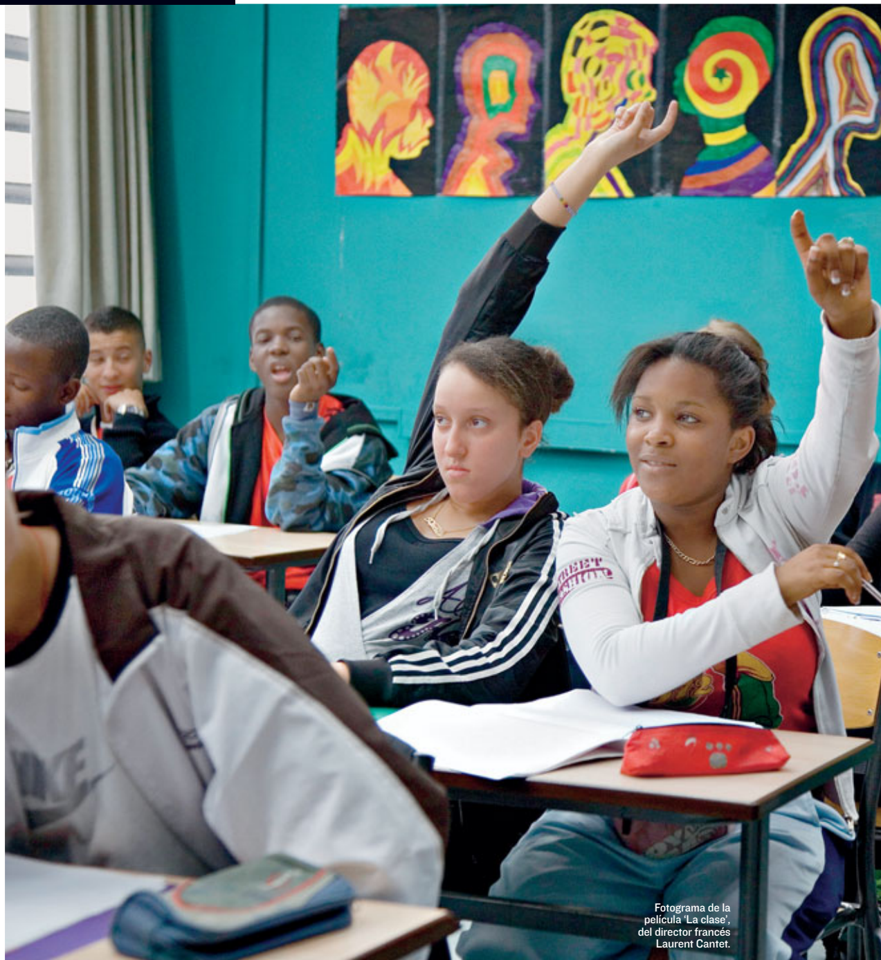
Fotograma de la película 'La clase', del director francés Laurent Cantet.