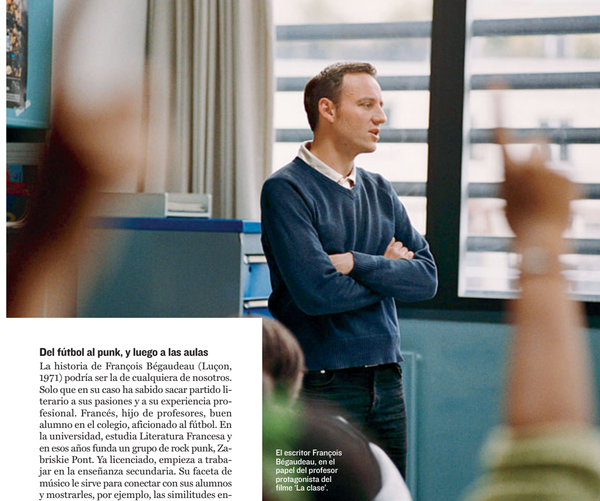
El escritor François Bégaudeau, en el papel del profesor protagonista del filme 'La clase'.

En 2003 publica su primera novela y en 2005, dos más, una de ellas con el curioso título 'Un démocrate: Mick Jagger 1960-1969', un relato de ficción sobre el famoso músico de los Rolling Stones. Al año siguiente, en 2006, sale a la luz 'Entre les murs', en el que relata su vida como profesor de instituto en París. En una entrevista de Elianne Ros para 'El Periódico', Bégaudeau explicaba que con ese libro ha querido romper clichés respecto a los adolescentes, sobre todo el tópico de los alumnos malvados y problemáticos. Lo hace con humor, sin acritud, pero intentando reflejar la compleja realidad que se vive hoy día en las aulas. El libro ha vendido más de 200.000 ejemplares en su país y ahora, gracias a la película 'La clase' (Palma de Oro en el Festival de Cannes 2008) su historia se dará a conocer en todo el mundo. ✱